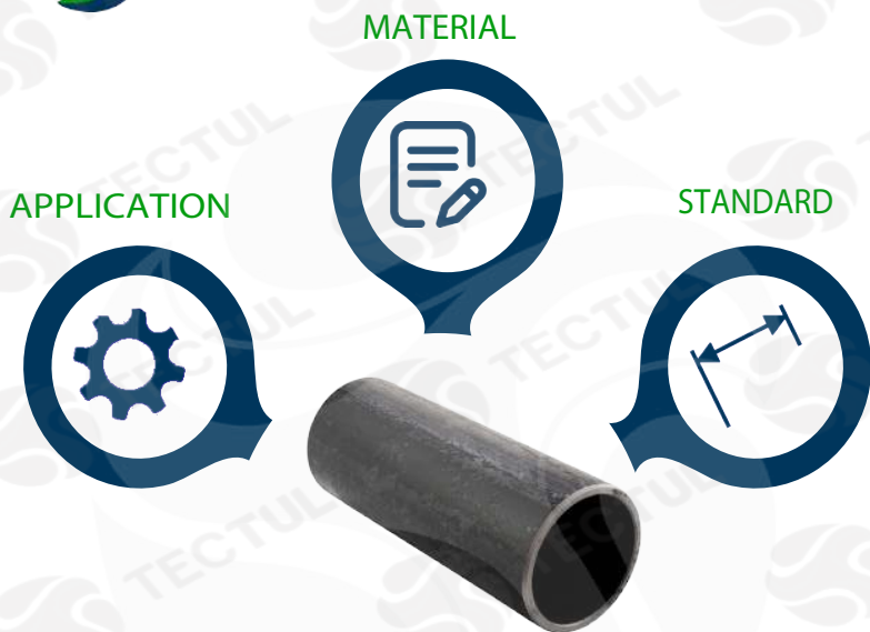
Cross section of carbon steel pipe